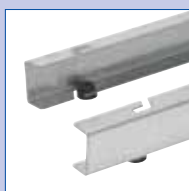
Staffe di supporto