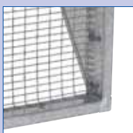
Griglie con tettuccio