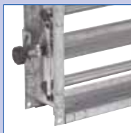
Serranda di taratura